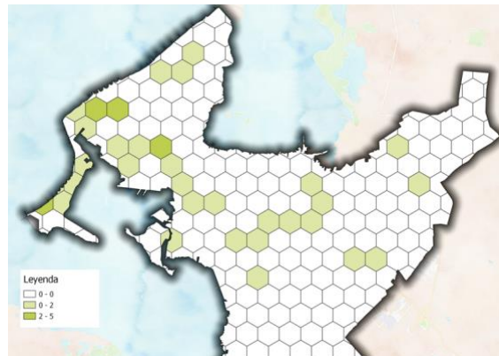
Imagen 6. Expendio por autoservicio de comidas preparadas