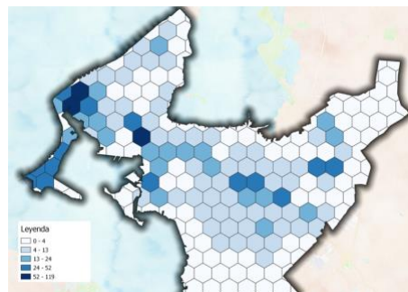
Imagen 3. Aglomeraciones productivas del sector turístico