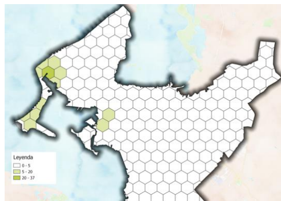
Imagen 4. Alojamiento en hoteles.