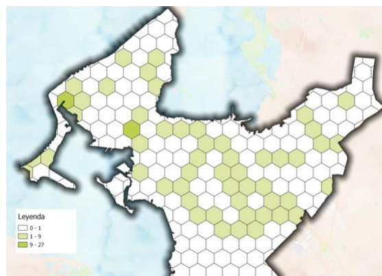
Imagen 5. Expendio de bebidas alcohólicas para el consumo dentro del establecimiento