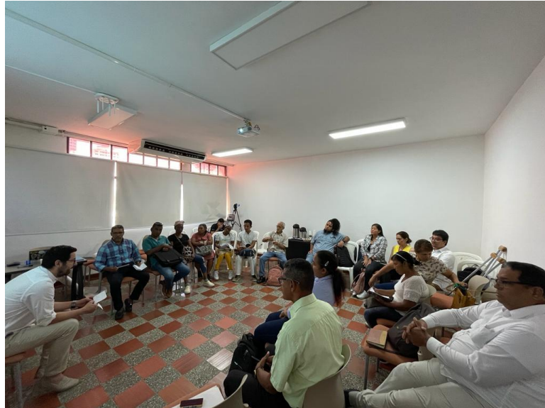
17 octubre de 2023