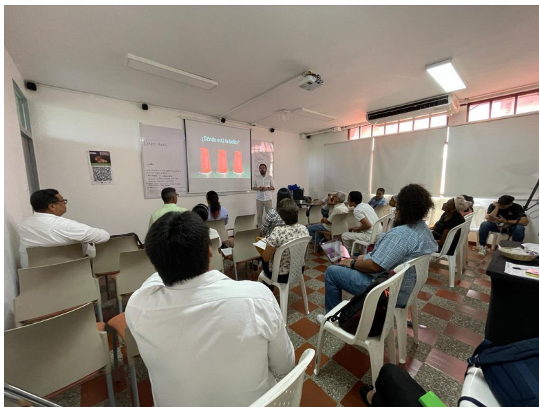
Foto: Taller de innovación / - 17 octubre de 2023