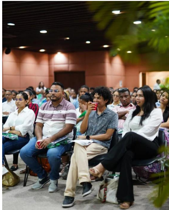
Foto: Encuentro de innovación / - 18 octubre de 2023